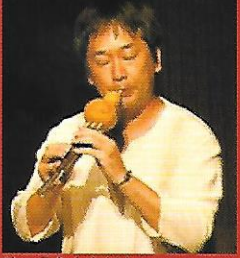
ひょうたんたけし