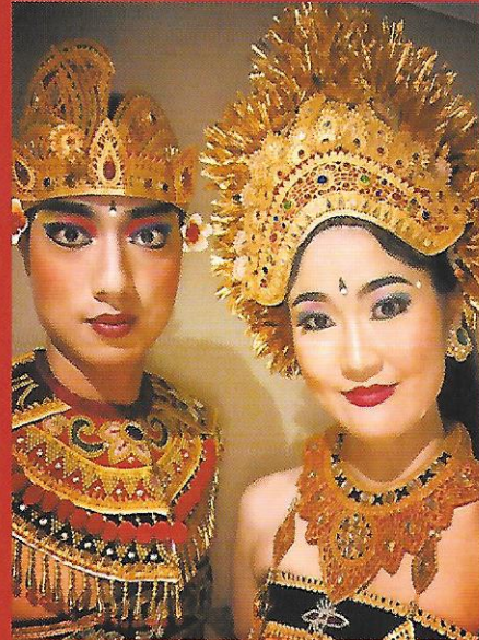
東京外国語大学 インドネシア舞踊部