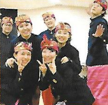
国立音楽大学 ガムラン部